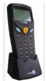
Cipherlab CPT 8300L